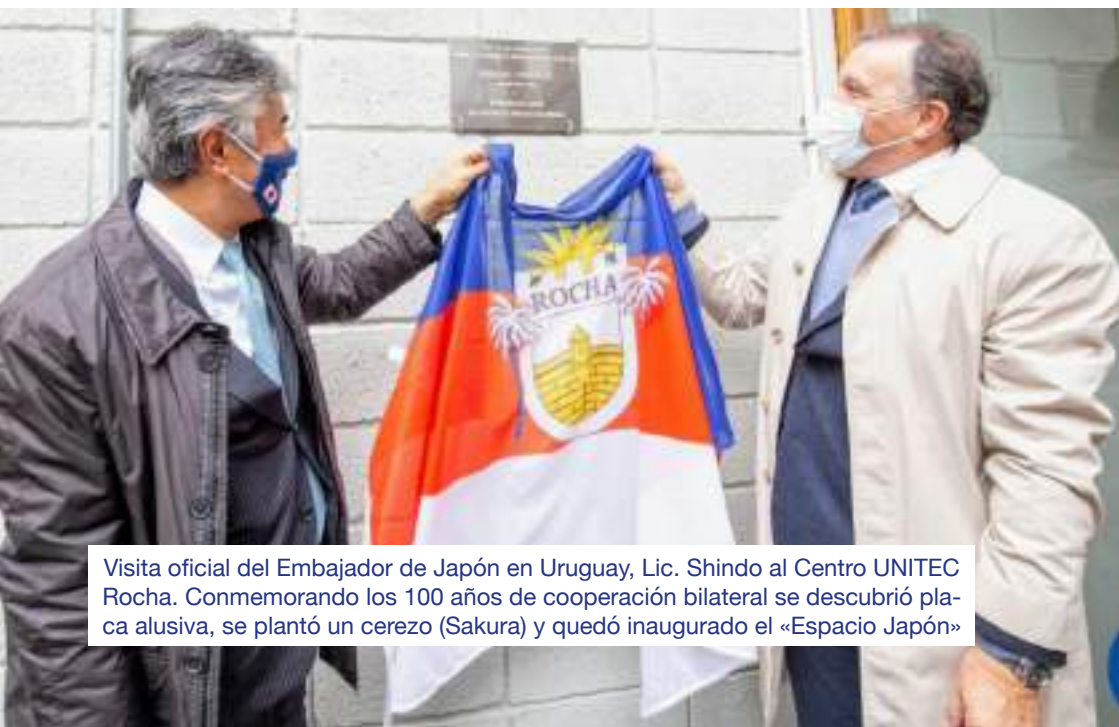
Visita oficial del Embajador de Japón en Uruguay, Lic. Shindo al Centro UNITEC Rocha. Conmemorando los 100 años de cooperación bilateral se descubrió placa alusiva, se plantó un cerezo (Sakura) y quedó inaugurado el «Espacio Japón»

Rocha más de 50 embajadores (EE.UU., Unión Europea, Gran Bretaña, China, Japón, Canadá, Francia, Alemania, Italia, Perú, Costa Rica, Irán, Corea, representantes de la ONU y sus distintas dependencias ONUSIDA, OIM, UNESCO, etc.) en el período, creándose fuertes vínculos con estas naciones y hemos promocionado a nuestra tierra con publicaciones, estadías, recorridos turísticos y por empresas insignia y productos típicos pero más importante ha sido la cooperación internacional que