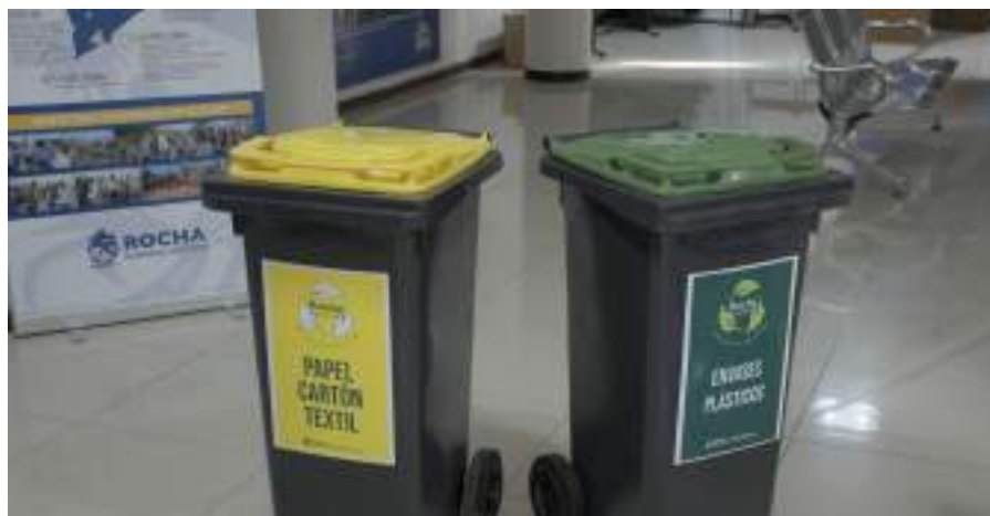
Se inició plan piloto de reciclaje de residuos en Rocha. Segundo departamento del Uruguay que lo hace.

Se tercerizó la recolección de residuos en Rocha, La Paloma, Costa Azul, La Aguada, La Pedrera hasta Oceanía del Polonio y Garzón, sumando a 19 de Abril y Velázquez lo que significó ahorros a la IDR en materia de personal, de gastos de reposición de contenedores, camiones, repuestos, combustibles, etc. y un mejor servicio ya que los camiones tienen seguimiento satelital y los contenedores chips que avisan si se hallan llenos.