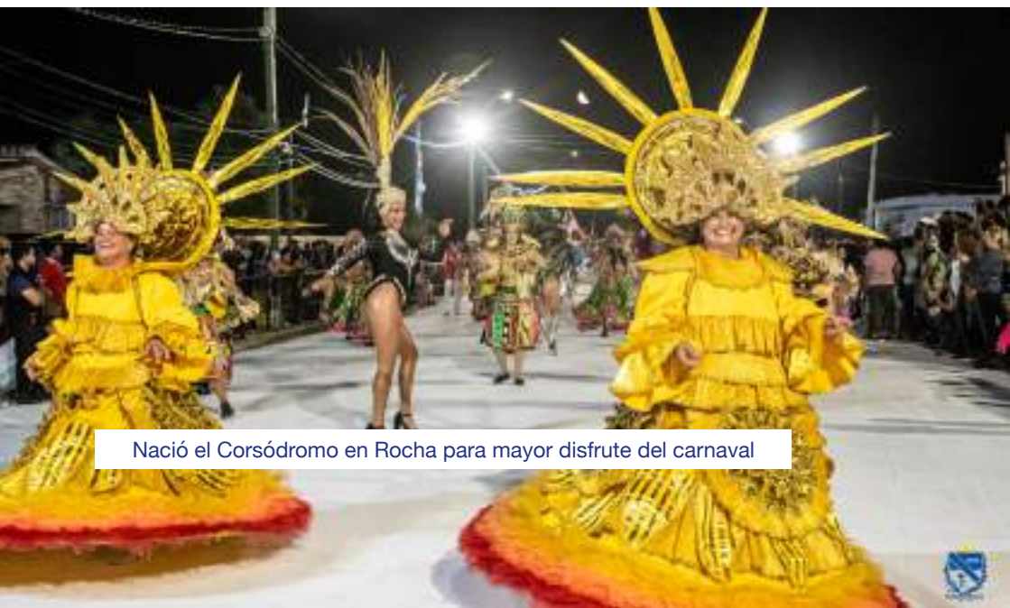
Nació el Corsódromo en Rocha para mayor disfrute del carnaval