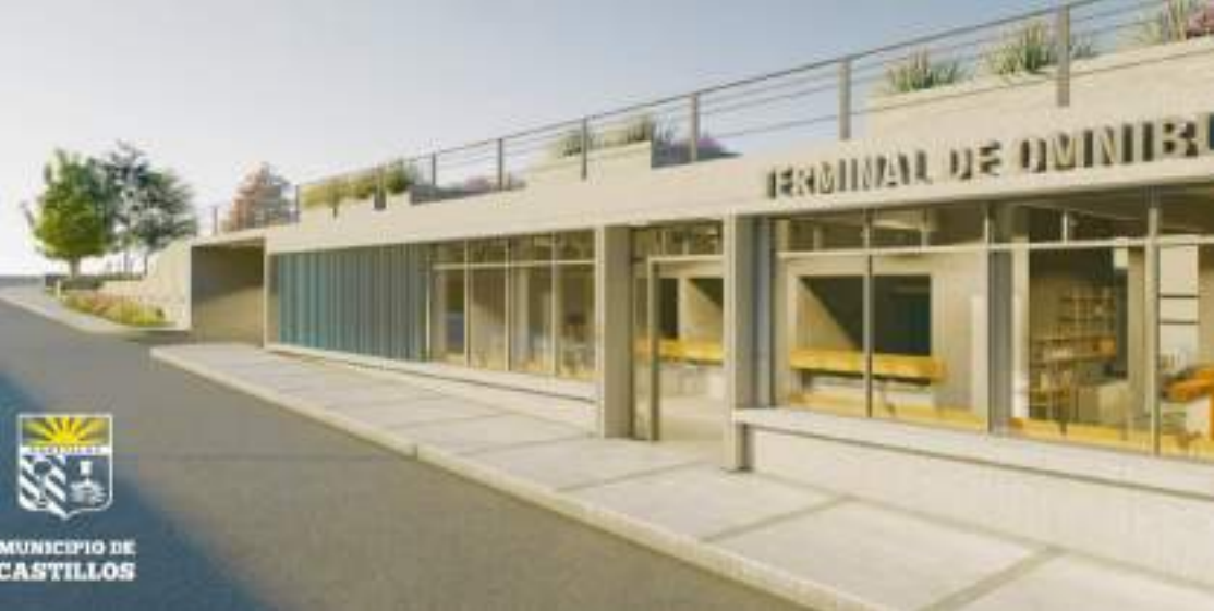
Nace la Terminal de Ómnibus de Castillos; una inversión de U$S 1.500.000