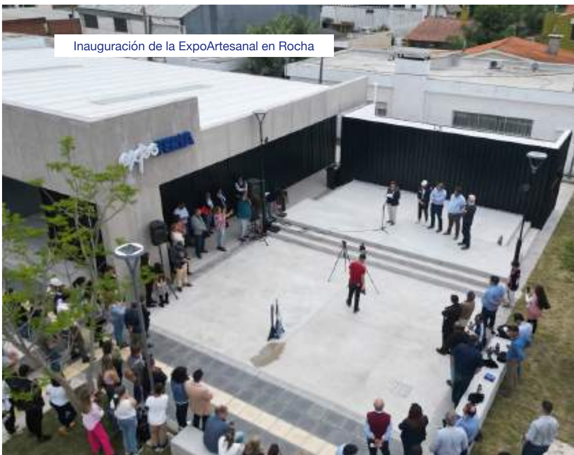
Inauguración de la ExpoArtesanal en Rocha