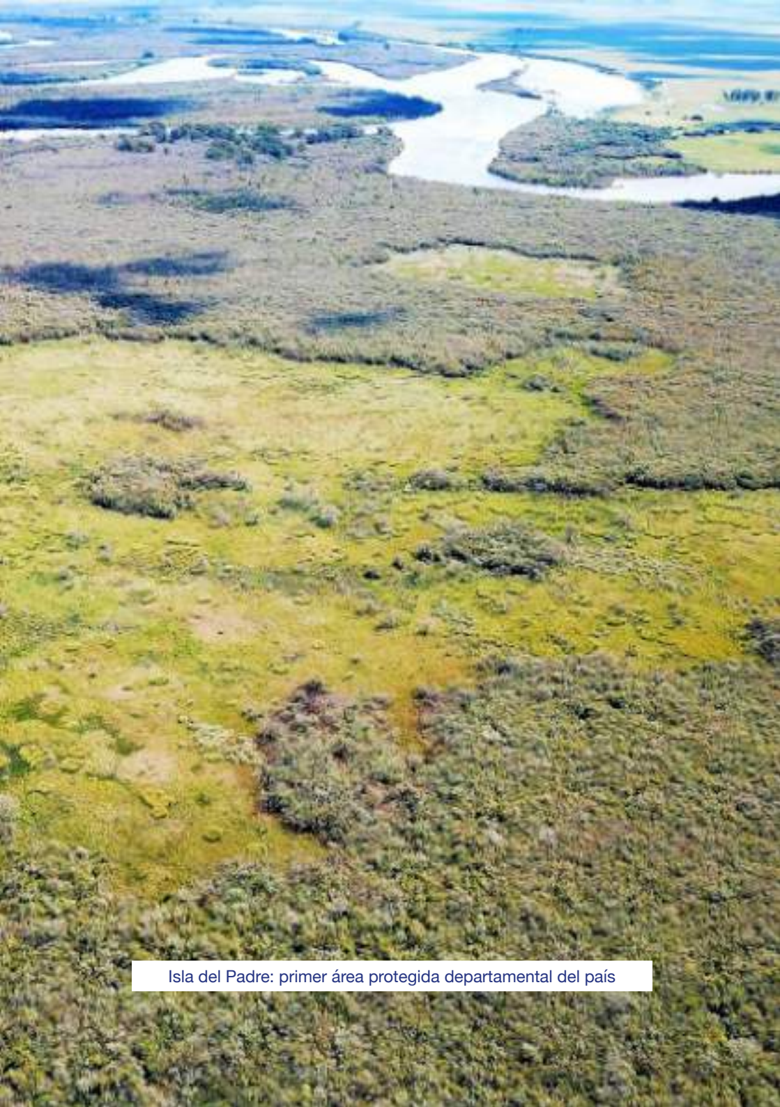
Isla del Padre: primer área protegida departamental del país