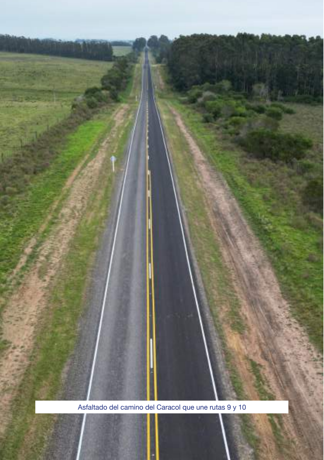
Asfaltado del camino del Caracol que une rutas 9 y 10