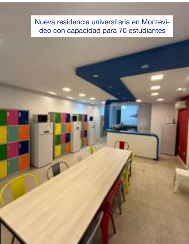
Nueva residencia universitaria en Montevideo con capacidad para 70 estudiantes