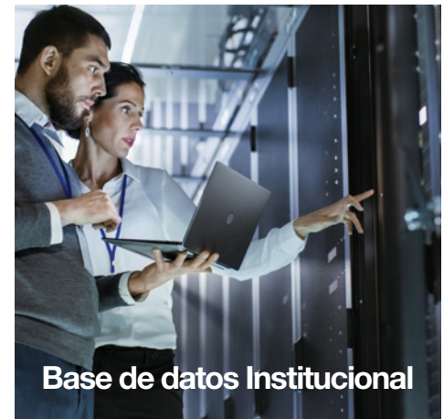
Base de datos Institucional