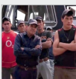
Miércoles 21 de agosto. A las 18.40 hs.- Segunda función. LOS OLVIDADOS DE LA TIERRA. Dir: Sietepueblos (colectivo integrado por Alicia Cano, Leticia Cuba, Sandro Pereyra y Victor Burgos). Uruguay 2011 – 45 min. (Digital)