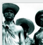
Jueves 22 de agosto. A las 18.40 hs.- Segunda función. QUEBRACHO. Dir: Ricardo Wullicher. Argentina 1972 – 95 min. (35 mm.)