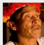
Viernes 23 de agosto. A las 17.00 hs.- Primera función. TIERRA ARRASADA. Dir: Victor Burgos. Brasil/Paraguay 2009 – 43 min. (Digital)

Los derechos de los trabajadores rurales asalariados no son paye, son ley.