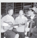
Miércoles 21 de agosto. A las 19.30 hs.- Tercera función. EL SUEÑO DE ROSE, DIEZ AÑOS DESPUÉS Dir: Teté Moraes. Brasil 1997 – 92 min. ST. (Digital) (O sonho de Rose, 10 anos depois)