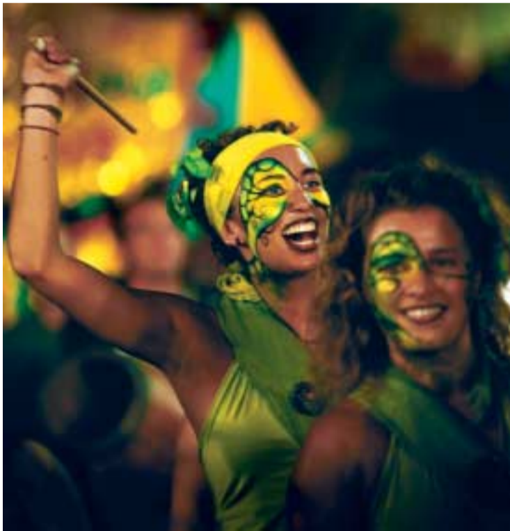
Integrantes de ‘La Melaza’ durante el Desfile de Llamadas de 2009.